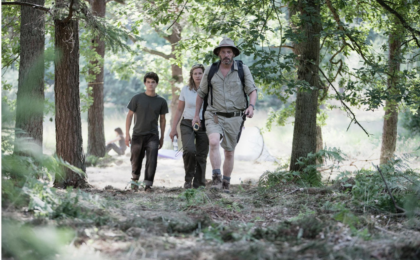
Links: als Richard III in het gelijknamige stuk van Shakespeare, woest én swingend. Boven: in de horrorfilm De Poel , waaraan hij meeschreef